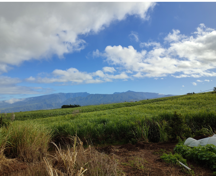
Fig. 1 ♦ Champ de canne à sucre dans le sud de l'île de la Réunion. Au second plan, on peut voir les massifs montagneux de l'île et notamment le Piton des Neiges dont le sommet culmine à 3071 m.

Doctorant en sociologie, LCSP / Université Paris-Cité