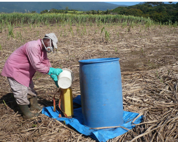
Fig. 4 ♦ Photo dénichée non sans surprise sur le site de la Chambre d'agriculture de la Réunion. On peut voir un planteur de canne à sucre remplir son pulvérisateur à dos avec un équipement de protection individuel rudimentaire.