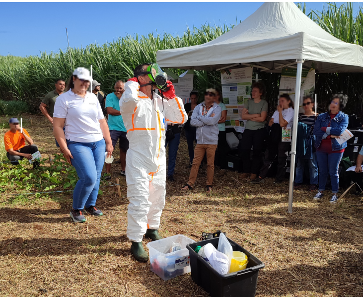
Fig. 3 ♦ Démonstration des «bonnes pratiques» de protection lors d'une journée de transfert technique sur les pratiques de désherbage de la canne à sucre.