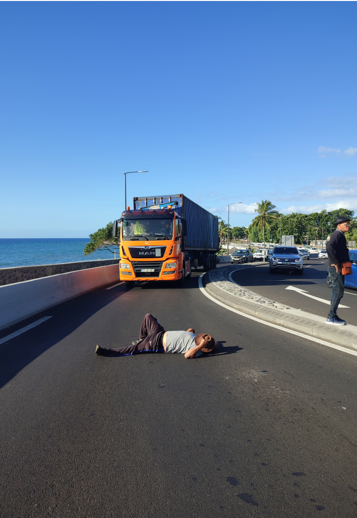
Fig. 5 ♦ «Mi mor pou la kann», «je meurs pour la canne». Planteur de canne à sucre qui bloque la route lors des mobilisations concer- nant la renégociation de la «Convention canne», Saint-Denis, Juin 2022.