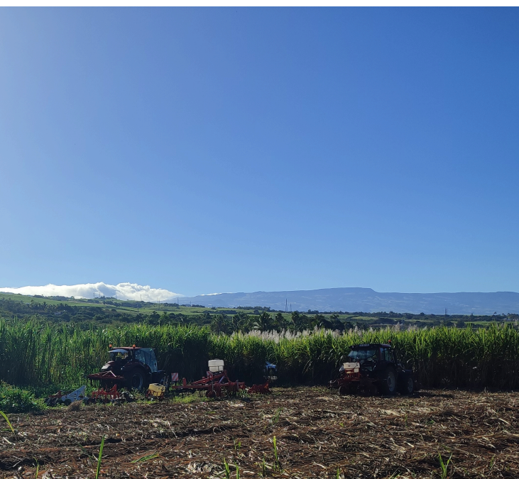
Fig. 6 ♦ Des «alternatives» au désherbage chimique de la canne à sucre ? Présentation d'alternatives mécaniques au désherbage chimique de la canne à sucre lors d'une journée de transfert technique sur les pratiques de désher- bage.