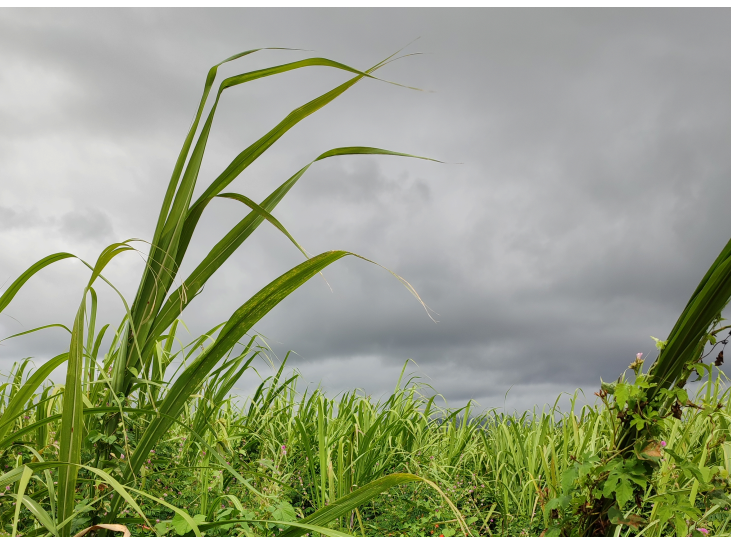
Fig. 2 ♦ Mové zerb, les «mauvaises herbes», champ de canne envahi par les «mauvaises herbes».